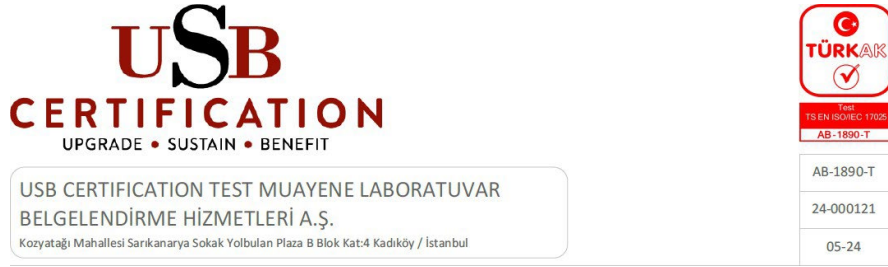
Şekil 5: USB Certification Akreditasyon Logosu ile Birlikte Kullanımı

4.5.15 www.usbcertification.com web sitesinin TÜRKAĞ sayfasında kullanılmaktadır.