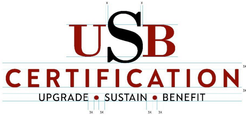
Şekil 1: USB Certification Logo Ölçüleri

4.3.4 USB Certification logosunun kullanım alanları küçüldükçe logonun da küçülmesi gerekmektedir. USB Certification logosunun okunmasının ve algılanmasının zorlaşmaması için minimum kullanım ölçüsü 10 mm olarak belirlenmiştir.