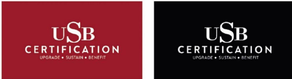
Şekil 3: USB Certification Farklı Zeminlerde Kullanımı

4.3.9 USB Certification logosunun farklı zeminlerde kullanılırken mutlaka okunmasını ve algılanmasını zorlaştırmayacak renk ve tonlar seçilmelidir. Okunurluğu arttırmak amacıyla logonun, zemin rengi ile kontrast olması gerekmektedir. Belirtilen standartlar dışında logonun başka bir kullanım şekli yoktur.