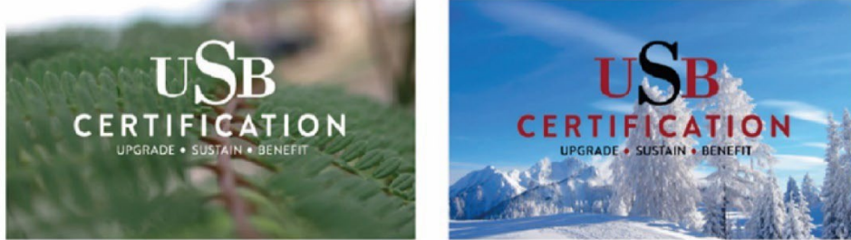
Şekil 3: USB Certification Logosunun Farklı Zeminlerde Kullanımı

4.3.10 USB Certification logosu fotoğraf üzerinde kullanıldığı zaman kontrast oluşturmaldır. Kullanılan fotoğraf üzerindeki logonun okunması ve algılanması zor olmamalıdır. Belirtilen standartlar dışında logonun başka bir kullanım şekli yoktur.